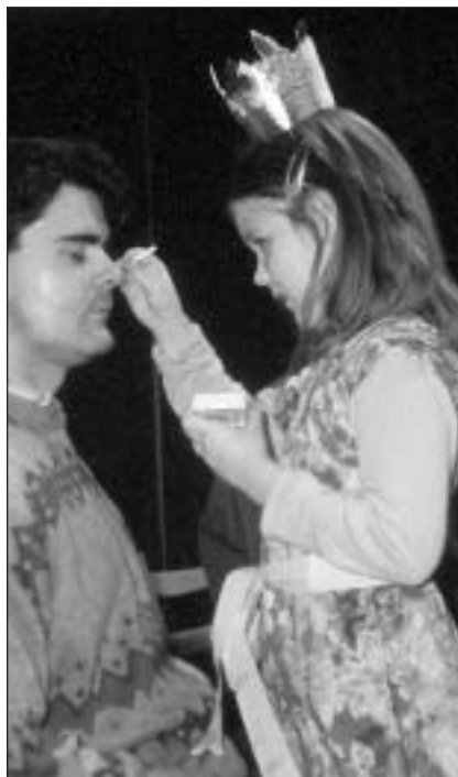
Karneval – maľovanie rodičov

16. 12. – Stretnutie chorých a rodinných príslušníkov, ktorým Samaritán poskytuje opatrovateľskú službu.